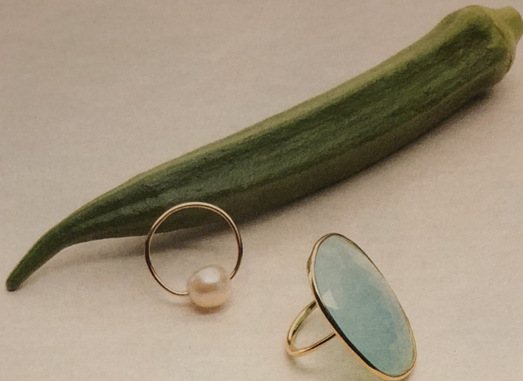
Bague «Crystal» en or jaune avec perle (à g.), Seame , env. 690 fr. Bague en argent doré et calcédoine (à dr.), Les Réveries d'Eve , 360 fr.